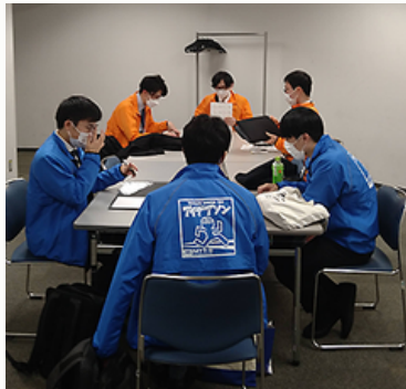
チーム内議論の様子 (併設会議室)