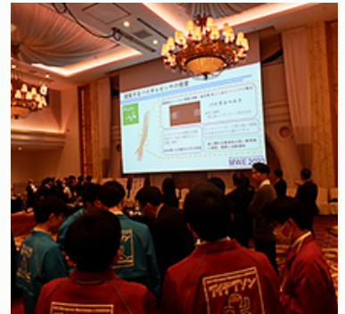
プレゼンテーション (出展者レセプション)