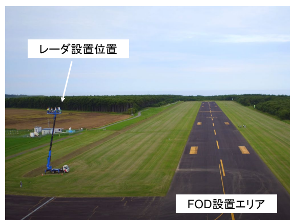
図2 空港滑走路におけるミリ波レーダセンサ部の試験状況の一例