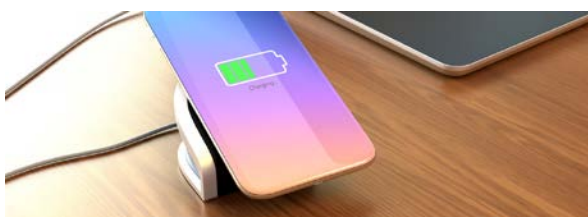
図.1 Qi の利用シーンの一例

電源ケーブル等を接続せずにモバイル機器や電気自動車等を充電する技術として WPT (Wireless Power Transfer / Transmission : 無線電力伝送) がある。WPT は、不要電磁波放射抑制や送受電機器間の相互接続性等が要求されることから、規制や規格の策定が不可欠である。本報告では、最大伝送電力を 15W まで拡大した Qi 規格および電気自動車/AGV 用 WPT の規制・規格策定の動向について報告する。