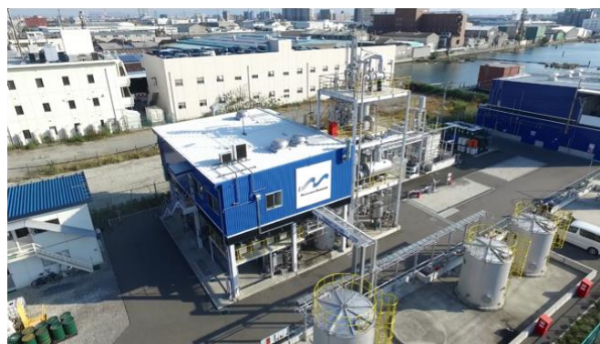
図2. マイクロ波化学マザー工場@大阪住之江