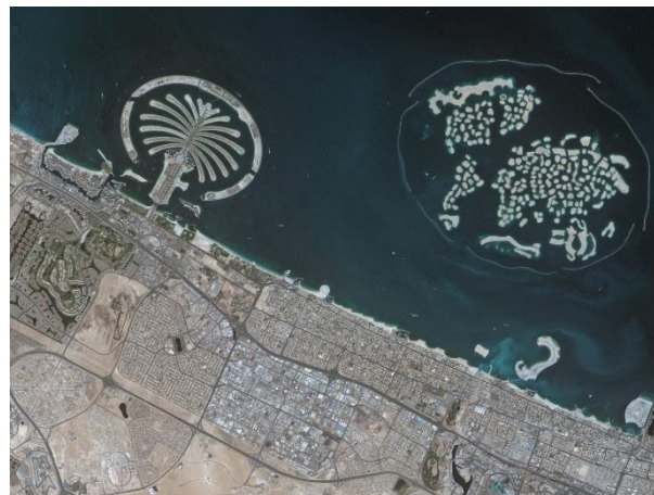
図 2 超小型衛星”ほどよし 1 号機”によるリモートセンシング画像例