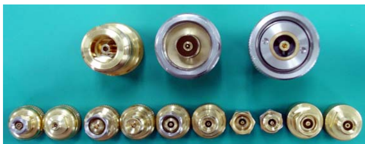
図 各種同軸コネクタ(計測用)

近年、ミリ波帯の回路・デバイス特性の評価ニーズが高まっている。それらの測定にはベクトルネットワークアナライザが用いられており、その測定原理は、従来と何ら変わらない。一方で、測定周波数が高くなることで、同軸コネクタの品質や測定セットアップの違いが測定精度へ影響を及ぼすこととなる。本ワークショップでは同軸コネクタの種類、メンテナンスに加え、測定システム構成、測定方法などの測定精度の向上に不可欠な知識や技術情報を紹介する。