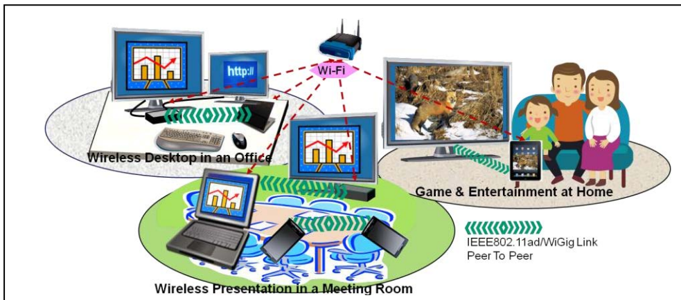
IEEE802.11ad/WiGig の高速無線通信イメージ

ミリ波回路の IC 化が実用的となり、IEEE802.11ad/WiGig 等のミリ波高速通信が注目されている。主要能動回路が IC 化されたためミリ波回路作製のハードルは格段に下がった。しかしながらミリ波機器商品化には、アンテナ設計、特性評価、およびコスト等、高周波に起因する課題も依然多い。本講演では、ミリ波高速通信実現に向けた要素技術や課題を概説し、初学者の技術形成の一助となることを目指す。