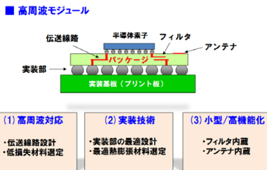
図2 5G に向けたパッケージと実装の課題